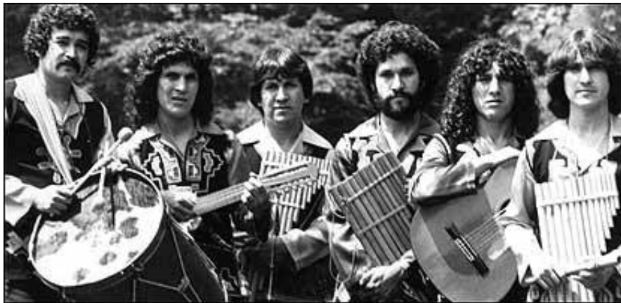
Illapu em finais de 70

pedidos de actuação na Europa e Estados Unidos, marcando assim o apogeu da música andina chilena e da sua vertente lírica de cariz social. A música torna-se mesmo na maior oposição ao regime de Pinochet no exterior com o lançamento, em 1974, da canção escrita em 1973 pelo compositor chileno Sergio Ortega perante a iminência de guerra civil que se vivia no seu país El pueblo unido jamás será vencido , nos discos de Inti-Illimani y Quilapayún (outro conjunto chileno exilado, também ele, de música tradicional, mais vocacionado para a Nueva Canción Chilena e música étnica do Sul, nomeadamente mapuche, que daria o nome "Três barbas") e cuja letra apresentamos na margem direita.