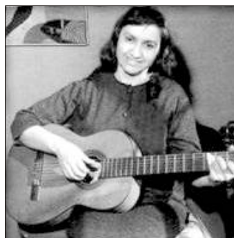
Violeta Parra nos seus primeiros anos de cantora

De pie, cantar que vamos a triunfar. Avanzan ya banderas de unidad. Y tú vendrás marchando junto a mí y así verás tu canto y tu bandera florecer. La luz de un rojo amanecer anuncia ya la vida que vendrá.