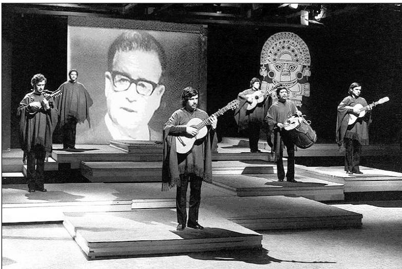
Inti-Ilamini em inícios de 70

O massacre horrendo do Estádio Nacional em Santiago e a vil tortura de Victor Jara que, amputadas as mãos, o que ele mais prezava para tocar guitarra, se viu sangrado até à morte, representava a afronta do novo regime perante o meio artístico, do qual Jara era um dos maiores representantes devido ao seu labor na composição musical, direcção teatral e poesia.