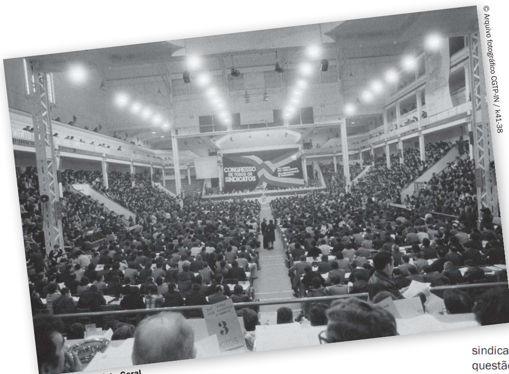
© Arquivo fotográfico CGTP-IN / K41-38