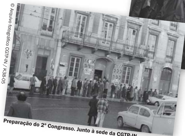
Preparação do 2º Congresso. Junto à sede da CGTP-IN.

Neste momento, em Portugal, estamos a ser governados com um programa de governo de um entidade que se chama Troika, que se sobrepõe às decisões dos portugueses, desresponsabilizando os partidos e as nossas instituições democráticas. Ou seja, os últimos governos não têm programa, esse é de uma entidade que não está credenciada. A Troika não é nenhuma entidade a quem tenha sido dado um mandato para governar Portugal, mas está a governar, com o governo do país a portar-se, vergenhosamente, como o governo de um país ocupado. Humilham os portugueses, quando nos impõem esse