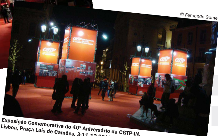
Exposição Comemorativa do 40º Aniversário da CGTP-IN. Lisboa, Praça Luís de Camões, 3-11.12.2010.