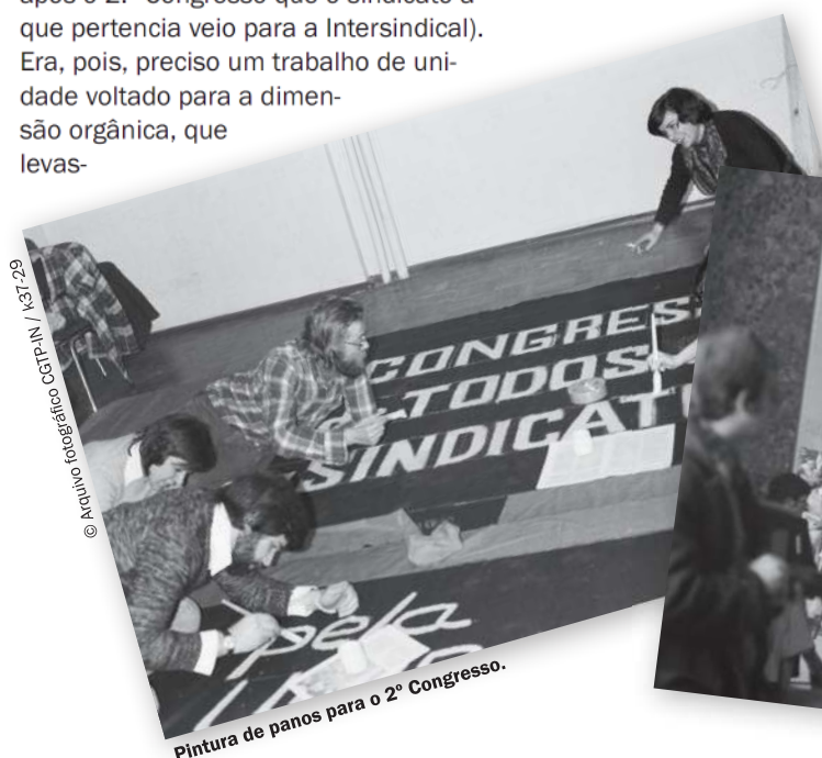
Pintura de panos para o 2º Congresso.