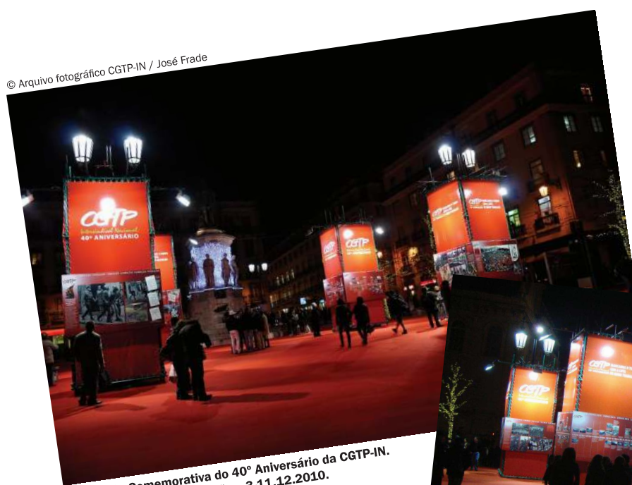
Exposição Comemorativa do 40º Aniversário da CGTP-IN. Lisboa, Praça Luís de Camões, 3-11.12.2010.