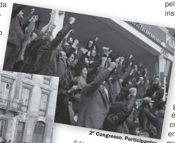
2º Congresso. Participantes. © Arquivo fotográfico CGTP-IN / K39-27