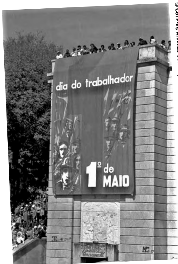
1.º de Maio de 1979. Lisboa.