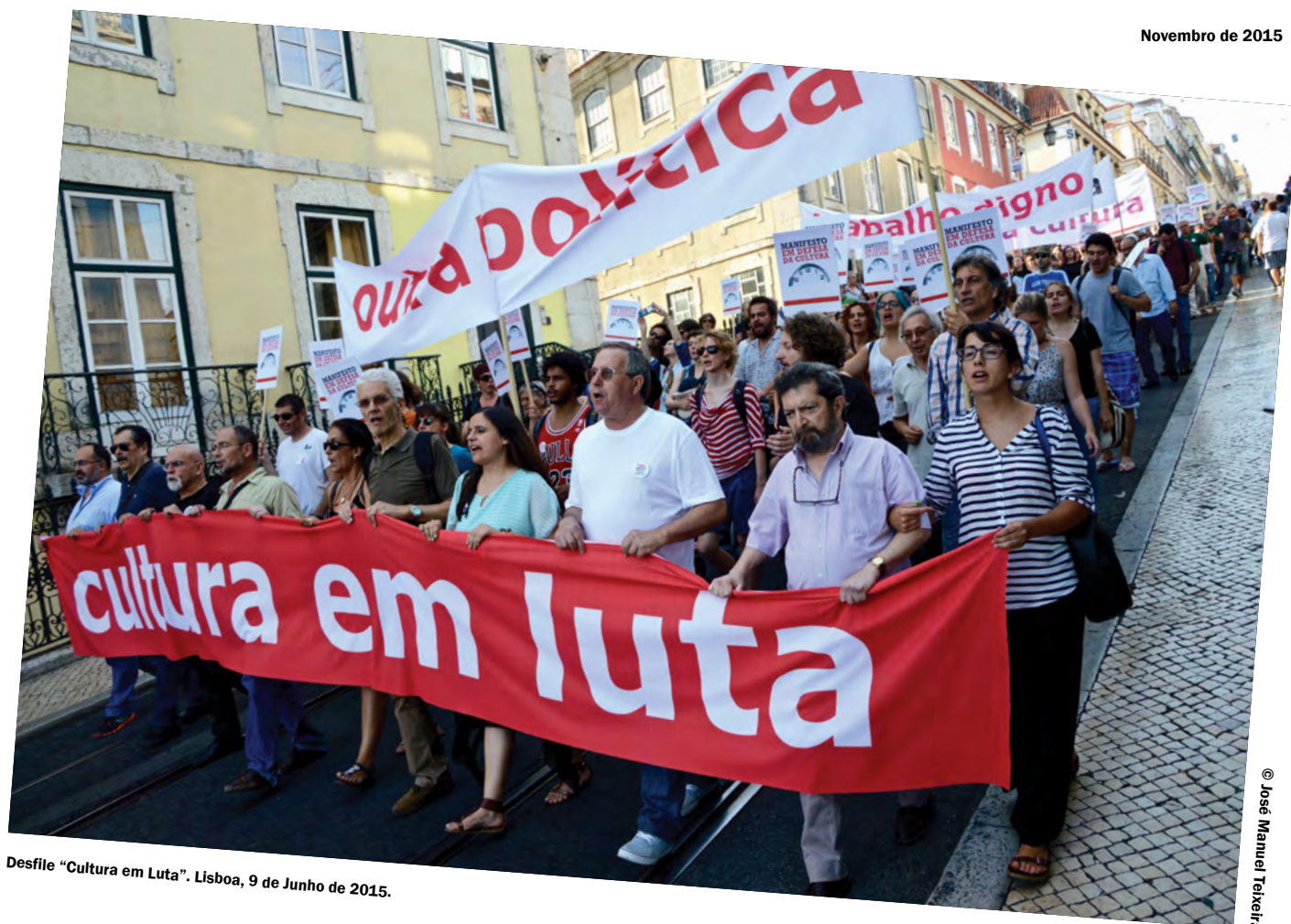
Desfile “Cultura em Luta”. Lisboa, 9 de Junho de 2015.