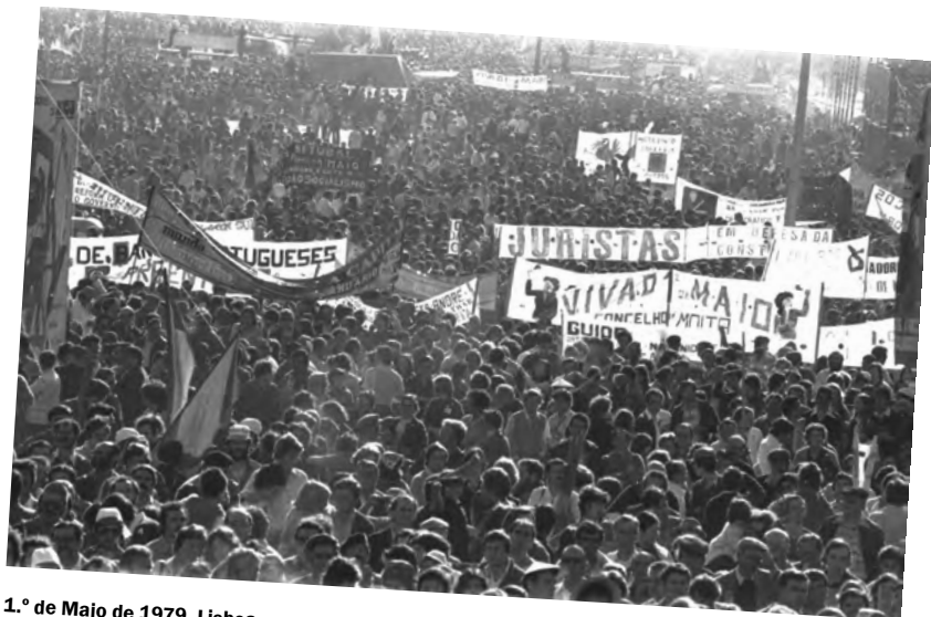
1.º de Maio de 1979. Lisboa.