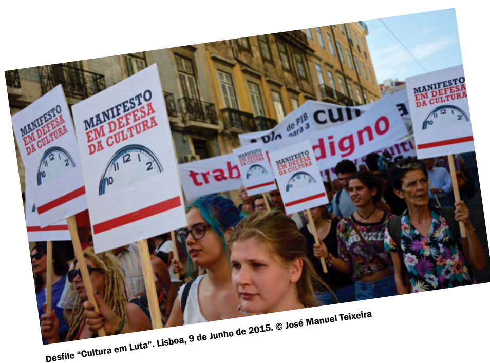
Desfile “Cultura em Luta”. Lisboa, 9 de Junho de 2015.

MDC: As políticas de austeridade abateram-se com especial violência sobre os sectores da actividade cultural, não apenas pela sua intensidade e os eixos ideológicos que as definiram, mas também porque esses ataques se produziram de múltiplos flancos. A sua dimensão mais mediatizada foram as políticas de governo que visaram directamente a actividade cultural, nos campos da produção artística, do património, do ensino especializado e do tecido associativo, reduzindo ou eliminando drasticamente os apoios financeiros, sem os quais ela não sobrevive, porque não sobrevive a sua liberdade, qualidade e diversidade. As políticas culturais, no sentido mais restrito, executaram profundas reestruturações na administração, nos serviços e nas funções culturais do Estado, desqualificando, desorganizando e tornando-os inoperacionais. Promovendo a acelerada mercantilização da Cultura, os governos deram livre curso a operações de desresponsabilização do Estado, de alienação de bens, equipamentos e funções. Atiraram a actividade cultural para a dependência das “indústrias culturais e criativas”, das indústrias do entretenimento, da publicidade e do turismo e dessa forma de fuga fiscal a que chamam “mecenato”. Os resultados foram a forte redução da programação,