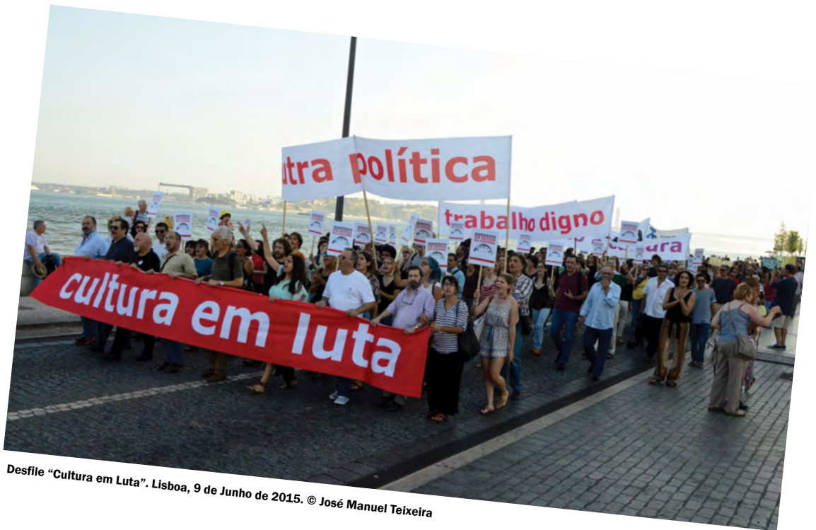
Desfile “Cultura em Luta”. Lisboa, 9 de Junho de 2015.

Reivindicamos a garantia de espaço de criação, difusão e apresentação da produção nacional.