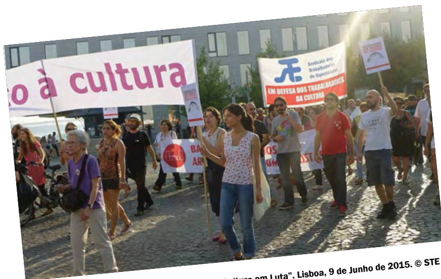
Desfile “Cultura em Luta”. Lisboa, 9 de Junho de 2015.

Sindicato dos Trabalhadores de Espectáculos (STE) Novembro de 2015