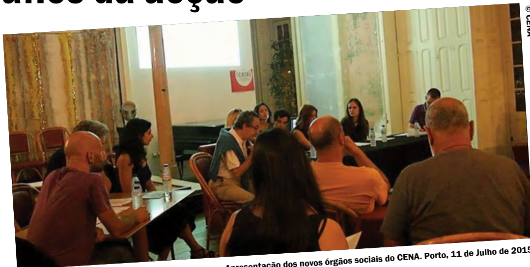
Apresentação dos novos órgãos sociais do CENA. Porto, 11 de Julho de 2015.

Respondendo à necessidade de informação sobre a realidade concreta em que estamos, a primeira medida da direcção do CENA, eleita em Junho, foi o lançamento de um questionário aos trabalhadores do espectáculo e do audiovisual. Um questionário simples mas que nos dará valiosas informações em três áreas fundamentais: contratação, situação financeira, situação social. Queremos e cremos que, em conjunto e com contacto cada vez mais constante com os trabalhadores, este será um passo importante na criação de condições para exigir de forma consistente e definitiva a criação de instrumentos de regulamentação do sector.