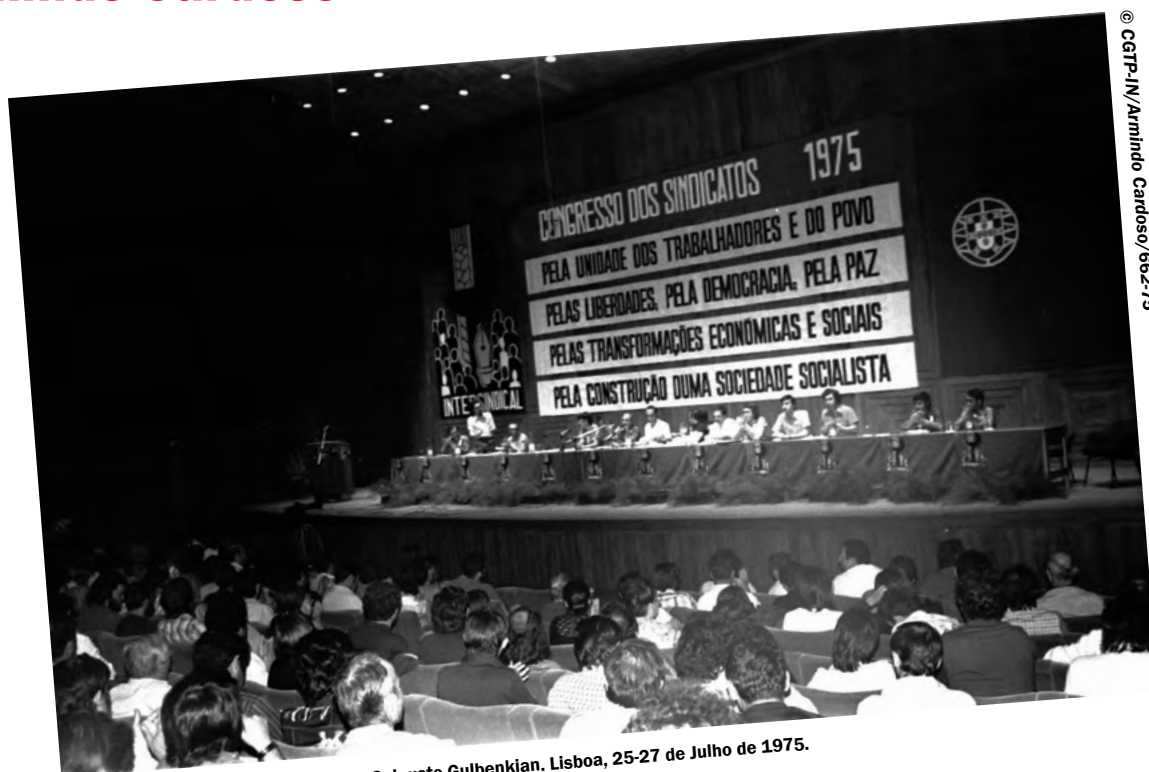
1.º Congresso da CGTP-IN. Fundação Calouste Gulbenkian. Lisboa, 25-27 de Julho de 1975.

O Centro de Arquivo e Documentação (CAD) da CGTP-IN tem vindo a dar continuidade ao tratamento arquivístico do acervo fotográfico, que, a par das colecções de jornais/revistas Alavanca e de cartazes, constitui a documentação mais procurada, tanto por utilizadores internos como externos.