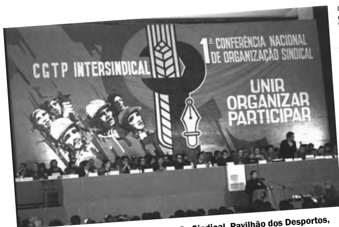
1.ª Conferência Nacional de Organização Sindical. Pavilhão dos Desportos, Lisboa, 17-18 de Fevereiro de 1978.