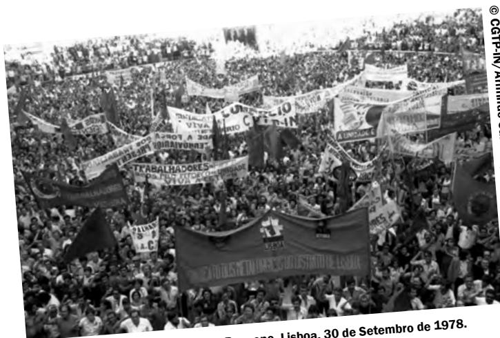
8.º Aniversário da CGTP-IN. Campo Pequeno, Lisboa, 30 de Setembro de 1978.

Este trabalho consiste na descrição e na digitalização desta documentação, uma forma de a preservar, a longo prazo, evitando o manuseamento dos originais e promovendo a sua divulgação em linha (sítio web do CAD). Ao tornar esta documentação acessível para consulta, este trabalho assume-se, também, como um contributo para o desenvolvimento do estudo do movimento operário e sindical